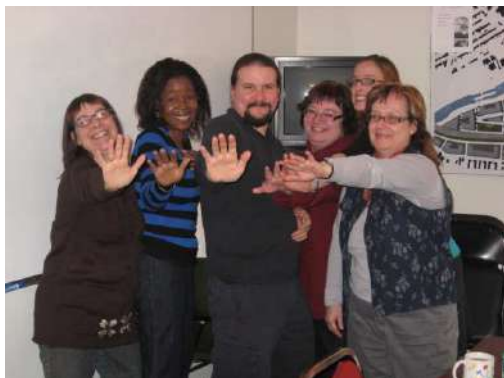
Le C.A. et la coordonnatrice de la Table

L'année a été bien remplie pour le Conseil d'administration qui s'est réuni à 10 occasions. Le Conseil a su relever avec brio et toujours avec enthousiasme les défis de la concertation! Un grand merci!